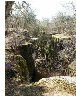
Une vue de la phosphatière du Cloup d'Aural

Explorations et recherches récentes en spéléologie physique et karstologie